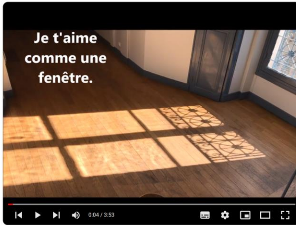
Je t'aime comme une fenêtre